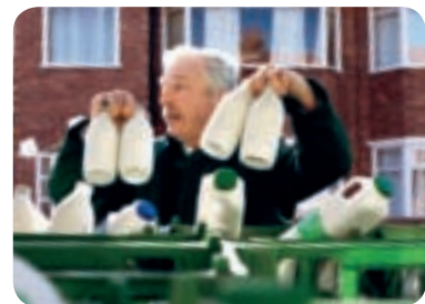
Arla Foods UK plc sålde sommaren 2006 sin mjölkbudsverksamhet till Dairy Crest Group plc. Anledningen var bland annat att den fallande försäljningen genom mjölkbud gjorde en rationalisering på området nödvändig. Under året ökade detaljhandels försäljning av Arla Foods mjölk Cravendale® med nästan 20 procent jämfört med året innan.

»Det var en positiv händelse när vi under hösten 2006 beslutade att ta ett viktigt steg in på den finska marknaden.«